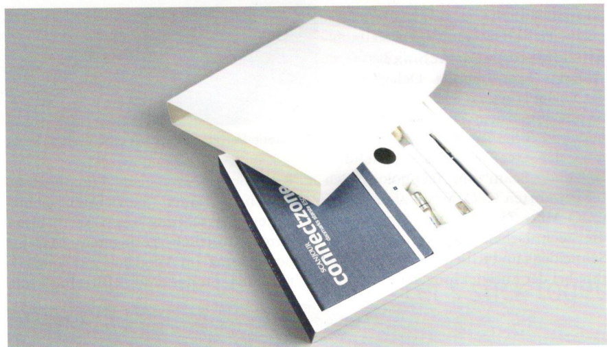
Schuber für wertvolle Inhalte: Der Schiebemechanismus der Schachtel lüftet das Geheimnis.