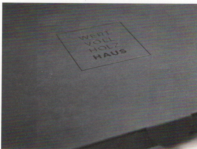
Hochwertige Veredelung: Farben, Formen, Design und Material finden stets zu einer Einheit.