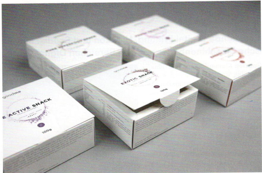
Bequemes Öffnen und Schließen: Schachteln mit Klappdeckel bieten einfaches Handling.